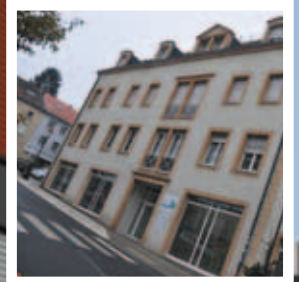
Les nouveaux locaux de la CCPN