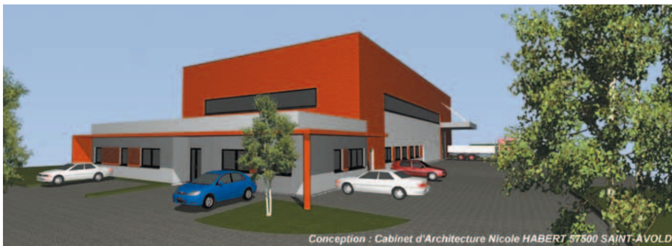
Conception : Cabinet d'Architecture Nicole HABERT 57500 SAINT-AVOLD

pouvoir échanger leurs expériences et générer des courants d'affaires.