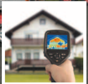
L'OPAH est en marche