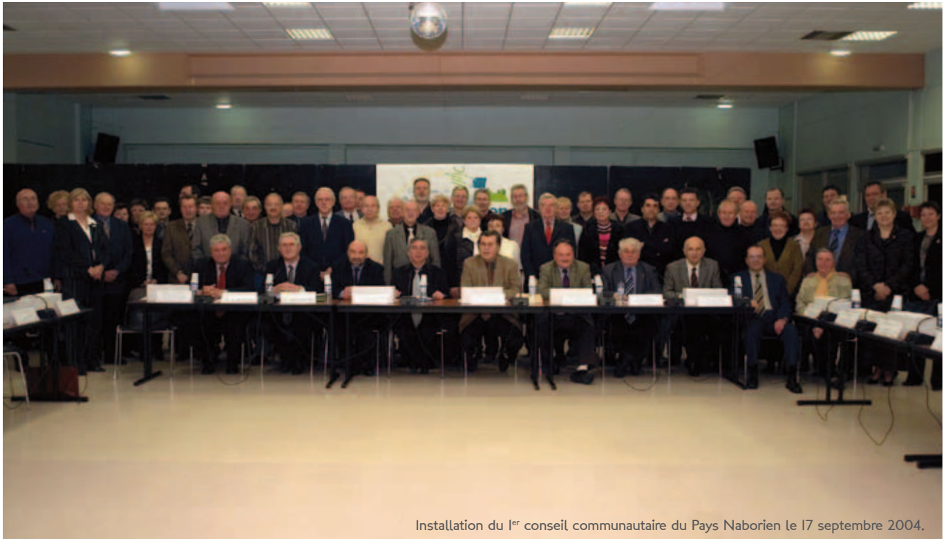
Installation du 1 er conseil communautaire du Pays Naborien le 17 septembre 2004.

Il faut remonter au 8 avril 1970 pour comprendre l'origine du regroupement intercommunal. En effet, à cette date, les 10 communes actuelles s'étaient unies suite à l'arrêt du puits de Faulquemont. La première mission assignée à cette union dénommée Sivom (Syndicat intercommunal à vocation multiple) a été de gérer la zone Actival qui a vu l'émergence de 2 000 emplois avec l'implantation de l'entreprise Bauknecht. La loi du 12 juillet 1999 relative au renforcement et à la simplification de la coopération intercommunale, dite loi «Chevènement», a mis en place un nouveau cadre institutionnel pour l'intercommunalité ainsi que des modalités permettant d'adapter les structures