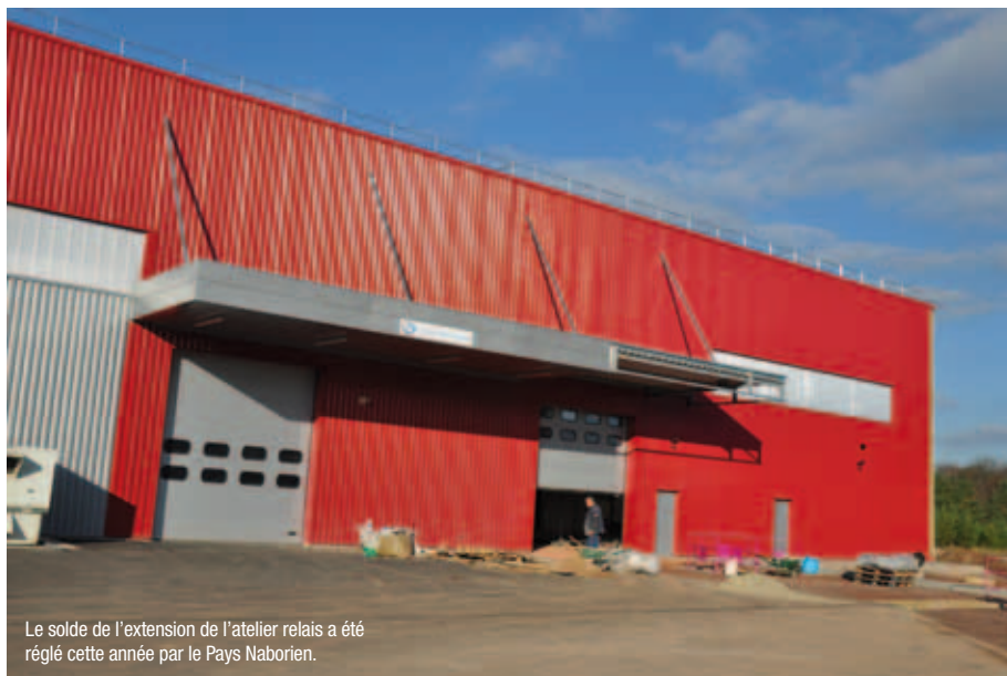
Le solde de l'extension de l'atelier relais a été réglé cette année par le Pays Naborien.

Pour mémoire, le compte administratif correspond à la clôture de l'exercice et enregistre l'ensemble des dépenses et des recettes réalisées dans l'année. C'est un élément fondamental dans l'analyse des finances de la collectivité puisqu'il permet de constater l'exécution du budget et de mesurer l'adéquation des résultats aux objectifs fixés. Le moins que l'on puisse dire, c'est que toutes les grandes orientations engagées dans le compte administratif 2014 du Pays Naborien, ont toutes été menées à bien. En effet, étaient inscrits au programme les projets suivants : les travaux liés au complexe nautique (rénovation du grand bassin, installation de bureaux et