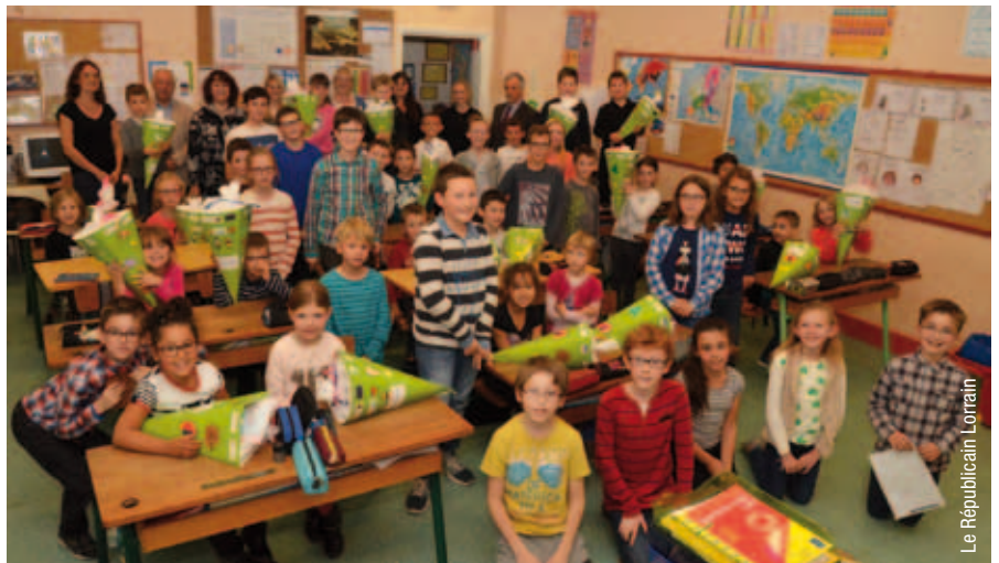
Le Républicain Lorrain

Ce n'est un secret pour personne. L'Allemagne constitue aujourd'hui une véritable terre d'opportunités, notamment pour les générations futures. Le marché du travail connaît une situation florissante avec un taux de chômage historiquement bas. Outre-Rhin, les entreprises ne se privent pas non plus de recruter des talents venus d'autres pays européens. En tant que département frontalier, la Moselle multiplie logiquement les initiatives avec son voisin allemand. De fait, la communauté de communes du Pays Naborien s'est engagée dans une politique d'anticipation, au même titre que ses homologues que sont les communautés d'agglomération Forbach Porte de France, communautés de communes de Freyding-Merlebach et celle du Warndt. Car anticiper, c'est d'abord intéresser les jeunes générations à l'apprentissage de la langue allemande. En octobre dernier, un projet élaboré en partenariat avec l'Éducation nationale, a été lancé. Il vise à mettre en place un programme expérimental et ambitieux, spécifique au Val de Rosselle, concernant l'apprentissage intensif d'un allemand de communication en lien avec le monde économique, à destination d'écoles maternelles et élémentaires ainsi qu'à destination des collèges.