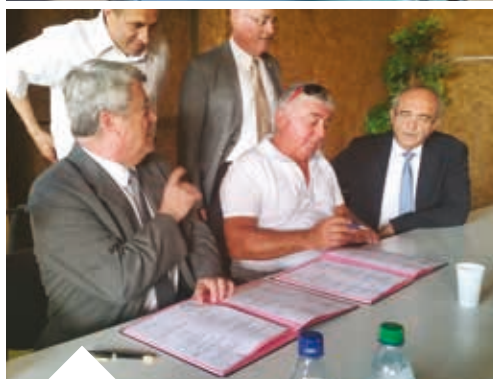
Politique de la Ville.