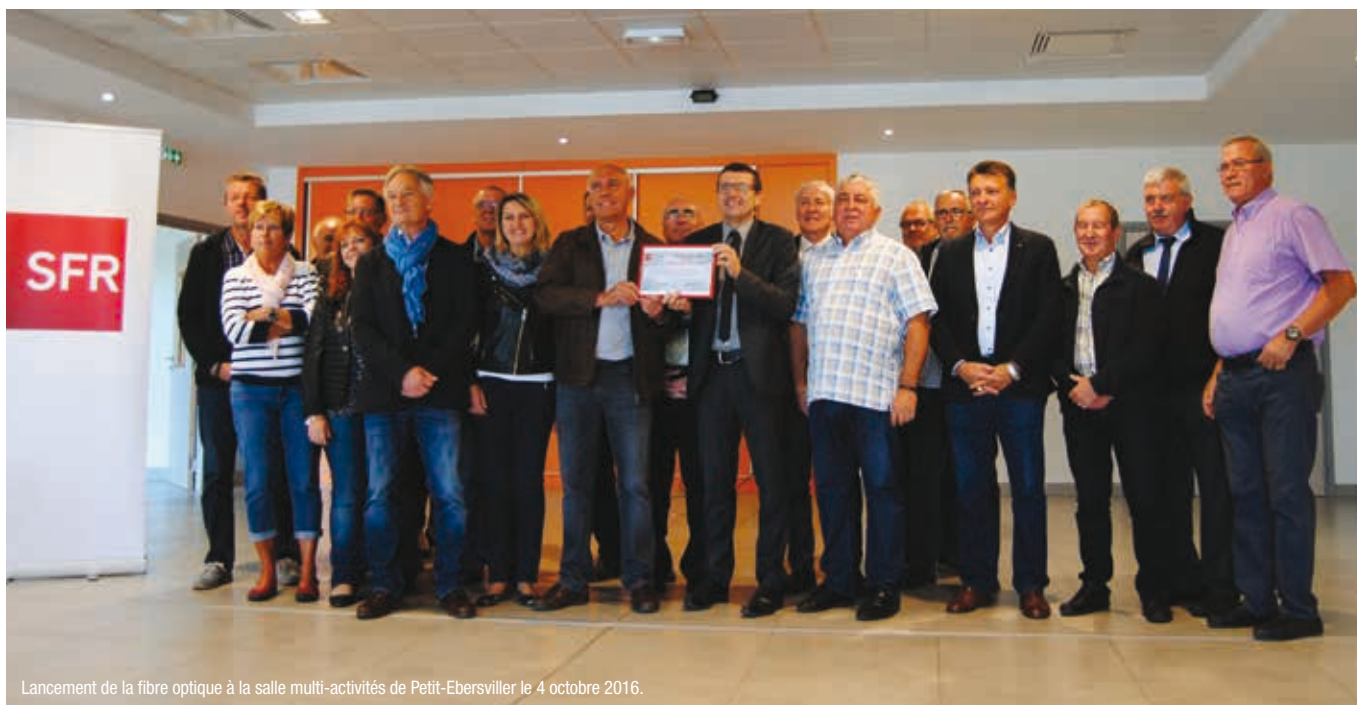
Lancement de la fibre optique à la salle multi-activités de Petit-Ebersviller le 4 octobre 2016.

APRÈS SAINT-AVOLD ET MACHEREN, CE SONT LES COMMUNES DE VALMONT ET FOLSCHVILLER QUI ONT ÉTÉ ÉQUIPÉ EN RÉSEAU FIBRE PAR LE FOURNISSEUR D'ACCÈS INTERNET SFR. AVEC UN DÉBIT DE 100 MBITS/S, L'ENSEMBLE DES LOGEMENTS ET DES LOCAUX PROFESSIONNELS PEUVENT BÉNÉFICIER DE LA FIBRE OPTIQUE, DIX FOIS PLUS RAPIDE QUE L'ADSL. SFR COMPTE BIEN COUVRIR L'ENSEMBLE DU TERRITOIRE DU PAYS NABORIEN D'ICI 2018. ÉTAT DES LIEUX.