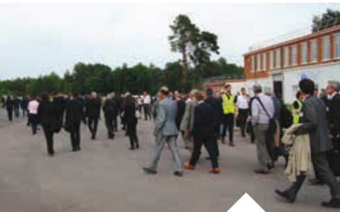
Adhésion à la Fédération intercommunale des commerçants et artisans du pays Naborien.