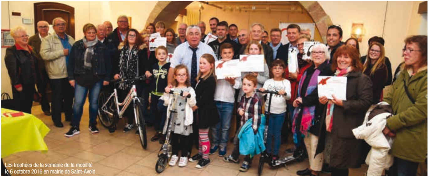
Les trophées de la semaine de la mobilité le 6 octobre 2016 en mairie de Saint-Avold.

Le 6 octobre dernier a eu la traditionnelle cérémonie de remise des trophées de la Semaine européenne de la Mobilité organisée par la communauté de communes du Pays Naborien en collaboration avec Transavold dans les locaux de l'Hôtel de Ville de Saint-Avold. Une manière de conclure de la plus belle des façons le rendez-vous de la Semaine européenne de la Mobilité sur la thématique « Optez