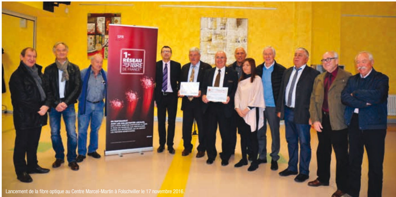
Lancement de la fibre optique au Centre Marcel-Martin à Folschviller le 17 novembre 2016.

Carling, Diesen, Folschviller, Lachambre, L'Hôpital, Macheren, Porcelette, Saint-Avold et Valmont seront éligibles à la fibre et profiteront ainsi de la vitesse et la performance qu'elle permet.