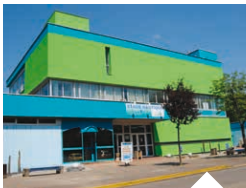
Complexe nautique de Saint-Avold.