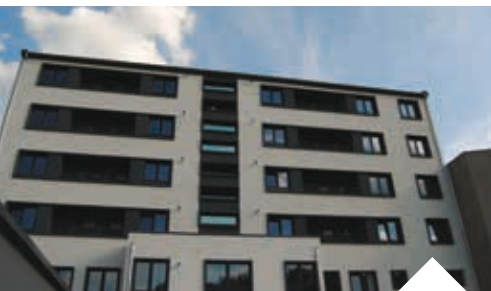
Élaboration d'un programme local de l'habitat.