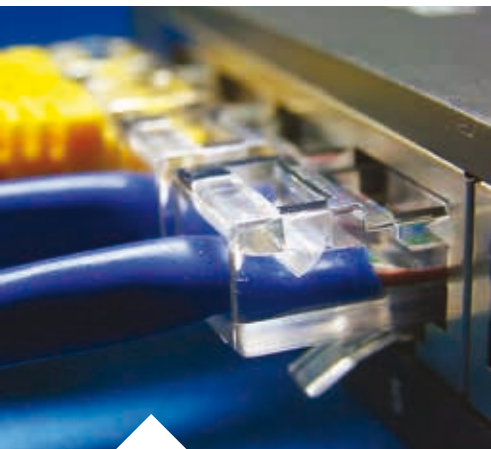
Étude, équipement et création de réseaux haut débit destinés aux zones industrielles et activités économiques gérées par la communauté de communes.