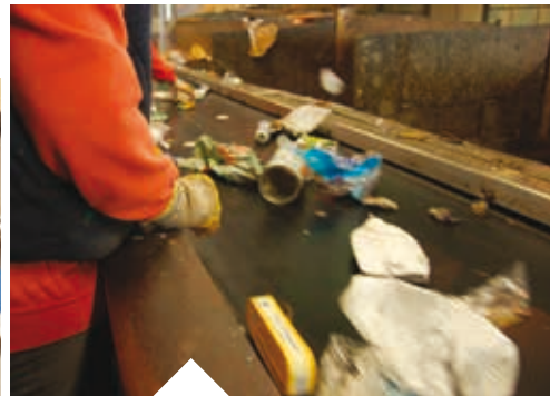
Collecte et traitement des ordures ménagères sur le territoire communautaire depuis le 1 er janvier 2009/ Adhésion au Sydeme.