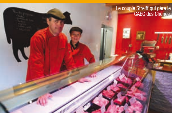
Le couple Streiff qui gère le GAEC des Chênes

« Ces dernières années, l'effondrement des prix associé aux mauvaises conditions climatiques ne nous a pas rendu la vie facile. Même si aujourd'hui, l'État nous promet des jours