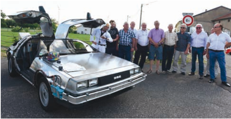
Les élus présents au Destry Rétro day à côté de la voiture de «Retour vers le futur» le 7 juillet 2018.