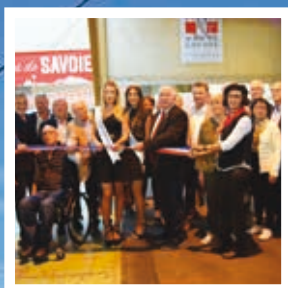
Le Salon Côté Champs