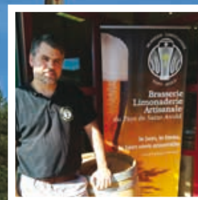
La brasserie du Pays de Saint-Avold