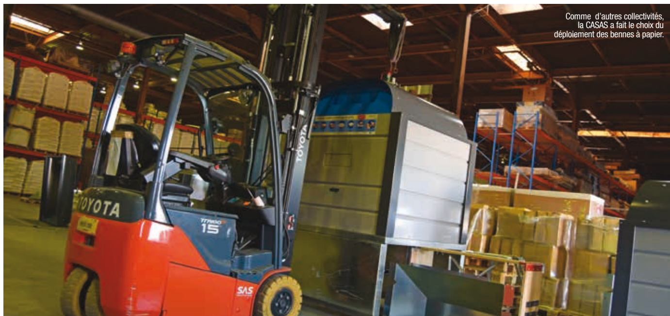
Comme d'autres collectivités, la CASAS a fait le choix du déploiement des bennes à papier.

Dans chaque domaine de compétences, la fusion des deux ex communautés de communes a entraîné son lot de changements. Le Service Environnement de la communauté d'agglomération nouvellement constituée, n'y fait pas exception. État des lieux.