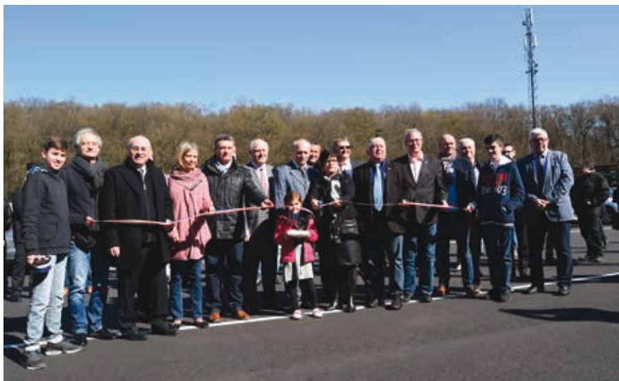
Inauguration de l'extension de l'entreprise SFL sur la zone du Fürst à Folschviller le 5 avril dernier.

Synergie n°1 • Édité par la Communauté d'Agglomération Saint-Avoid Synergie • Directeur de la publication : André Wojciechowski • Rédacteur en chef : Frédéric Muller • Secrétariat de rédaction : Agence Evicom • Rédaction : Agence Evicom, les membres de la commission communication • Conception éditoriale et graphique : Agence Evicom • Photos : Evicom & Commission communication de la CASAS • Impression : Evicom. Dépôt à parution • Tirage : 25 000 exemplaires.