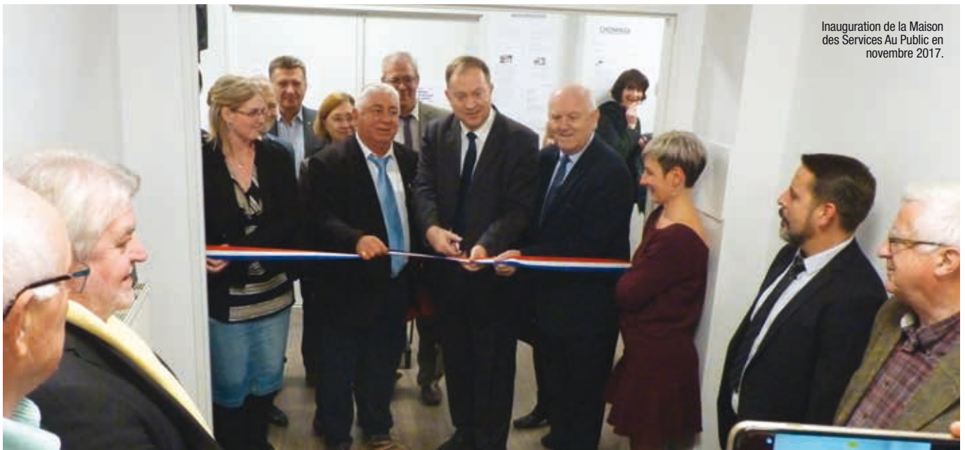
Inauguration de la Maison des Services Au Public en novembre 2017.

Inaugurée en novembre 2017, la Maison des Services Au Public est le lieu incontournable pour accueillir, informer, orienter, aider et accompagner toutes les personnes qui en expriment le besoin. Présentation.