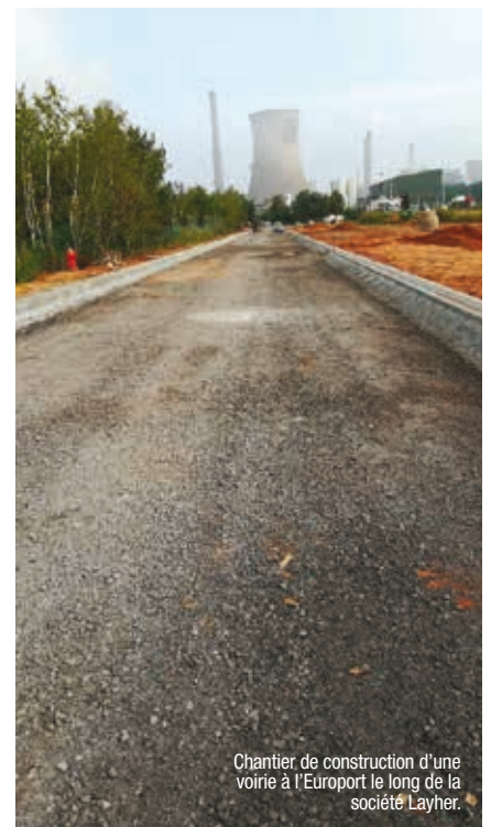
Chantier de construction d'une voirie à l'Europort le long de la société Layher.