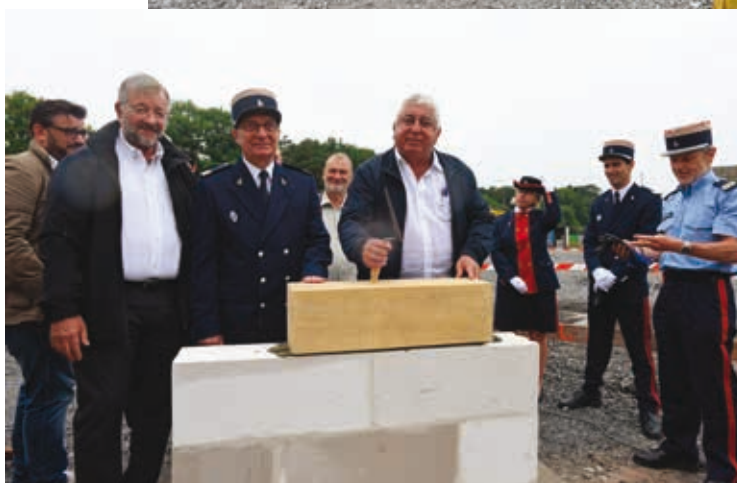
Pose de la 1 re pierre du bâtiment des douanes à la VAC le 5 juillet 2018.