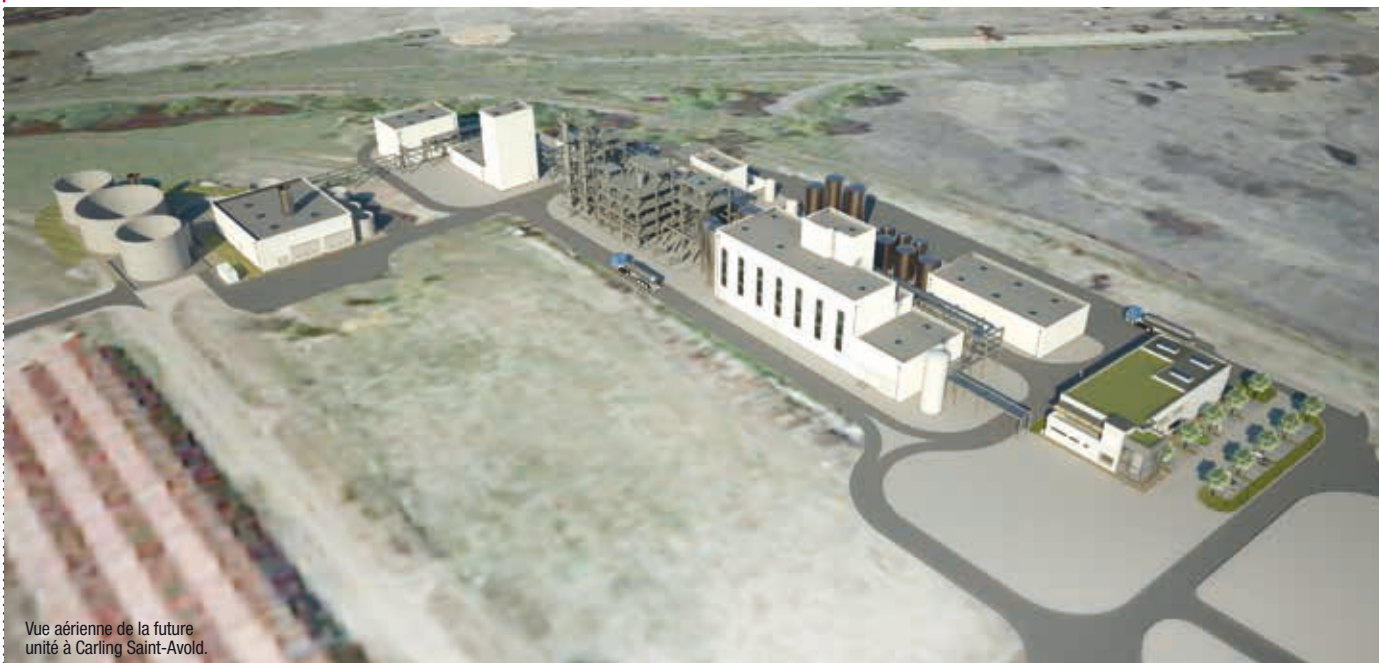
Vue aérienne de la future unité à Carling Saint-Avoid.